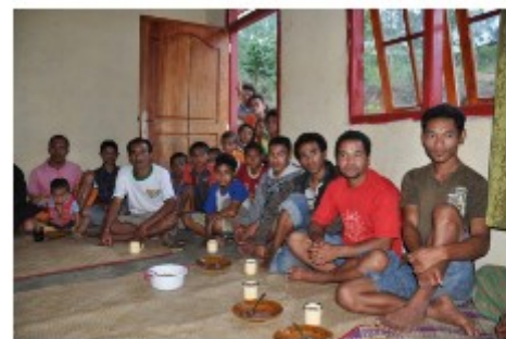
ONTMOETING IN MESIR

2009 Bangladesh - arbeidsintegrati oeamen € 18.000 medicijnen 2009 Zuid Afrika gebouwen 12000 13000 Kenia € 5000 2008 Brazilië - 12000 Schiedam 13000 € 1000 2008 Malawi - 12000 13000 Kanaga € 2000 Indonesië- Java-Solo - 12000 13000 14000 Blariacumcol 2008 Ethiopië - opvang "oma's" € 1400 Gambia - 2008 Ghana- Gambia - 1400 1500 1600 1700 1800 1900 2000 2100 2200 2300 2400 2500 2600 2700 2800 2900 3000 3100 3200 3300 3400 3500 3600 3700 3800 3900 4000 4100 4200 4300 4400 4500 4600 4700 4800 4900 5000 5100 5200 5300 5400 5500 5600 5700 5800 5900 6000 6100 6200 6300 6400 6500 6600 6700 6800 6900 7000 7100 7200 7300 7400 7500 7600 7700 7800 7900 8000 8100 8200 8300 8400 8500 8600 8700 8800 8900 9000 9100 9200 9300 9400 9500 9600 9700 9800 9900 10000